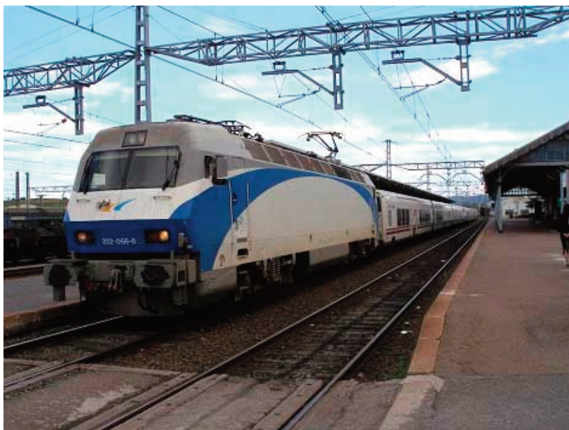
Figura 2: La 252-066 remolca la composición de Talgo IV “Finisterre” (Barcelona-Sants – A Coruña/Vigo en días alternos) y “Covagonda” (Barcelona-Sants – Gijón), fotografiada en Miranda de Ebro (Burgos).

Originalmente, las locomotoras de la serie 252 se montaron sobre bogies de ancho UIC (unidades 1 a 15) y bogies de ancho Ibérico (unidades 16 a 75), siendo las primeras bitensión (25 kV AC / 3kV CC) y las segundas monotensión (3 kV CC). La evolución de la red de alta velocidad exigió progresivamente la adaptación de un número mayor de locomotoras a las características AV, hasta que el auge de las composiciones de automotores indeformables hizo disminuir su uso diario.