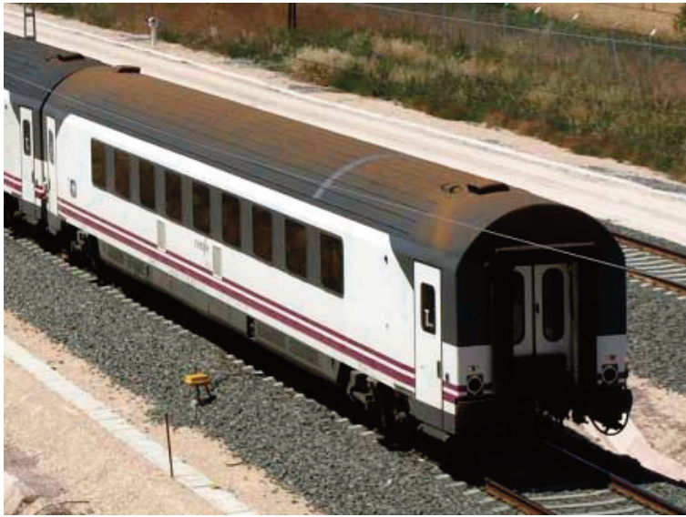
Figura 3: Un coche de clase Turista de la serie 2.000, en cola del Arco Irún/Bilbao-Abando – A Coruña/Vigo, en las cercanías de Quintanilleja (Burgos).

Los coches de la serie 2.000 provienen de una profunda transformación realizada a los coches B11x-10200 (antigua serie 10.000 de segunda clase), en el TCR de Málaga-Los Prados, para prestar servicios de gama media en el Corredor Mediterráneo. Actualmente circulan también en las relaciones País Vasco-Galicia, y en el refuerzo de servicios en puntas de tráfico.