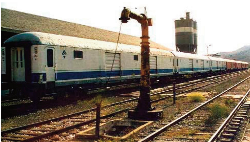
Figura 1: Furgones para el transporte de paquetería en trenes rápidos de viajeros, algunos de ellos preparados para circular a 160 km/h, esperando su desgüace en la estación de Soria-Cañuelo. Año 2003.

Se denomina “Tren completo” al tren de mercancías con un único origen y destino, que sirve generalmente a sectores aislados muy dependientes del ferrocarril para sus traslados: automóviles, siderurgia, graneles sólidos de bajo valor añadido, y productos químicos altamente peligrosos. La elección del ferrocarril como modo de transporte viene determinada por el elevado volumen de tráfico de dichos transportes, utilizando trenes que completan la carga remolcada admisible en la mayoría de los casos, y con una frecuencia de circulación fija. La ausencia de maniobras entre origen y destino (salvo las estrictamente necesarias por motivos técnicos), permite una regularidad en la circulación y unos costes económicos asumibles que justifican el uso del ferrocarril para dichos servicios.