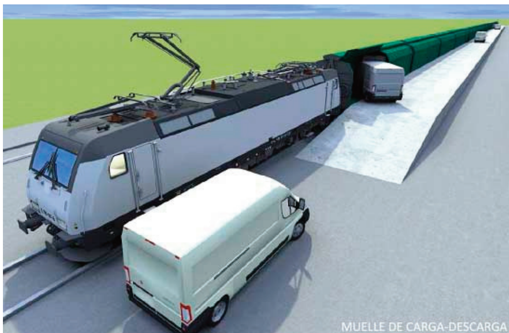
Figura 6: Carga de un tren VANELECTRA en una terminal adaptada a tal efecto.

Madrid-Sur es una base de mantenimiento situada en el P.K. 8,60 de la línea de Alta Velocidad Madrid-Barcelona. Para el acceso rodado, las ventajas principales de la ubicación propuesta son, en primer lugar, la cercanía a las autovías de circunvalación de Madrid M-40 y M-45, así como a las autovías de Andalucía (A-4), y M-31. En segundo lugar, la proximidad de la plataforma logística Mercamadrid.